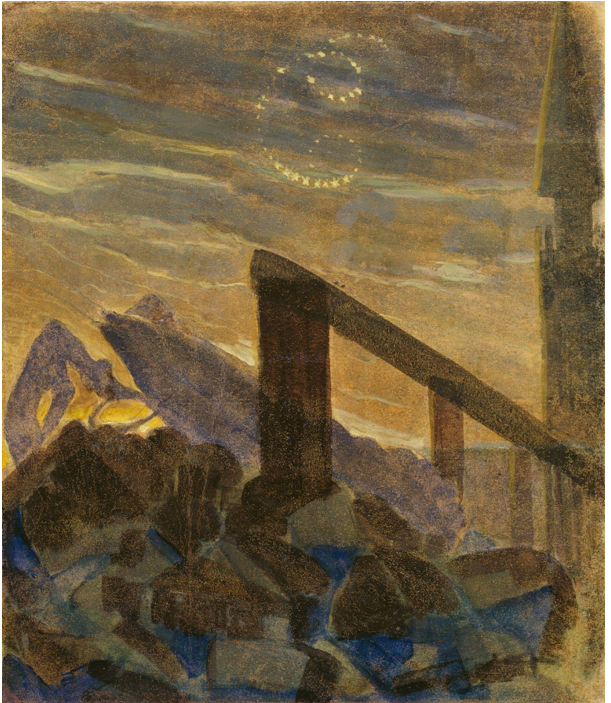
Saulė eina Vėžio ženklą. VI paveikslas iš ciklo „Žodiakas“