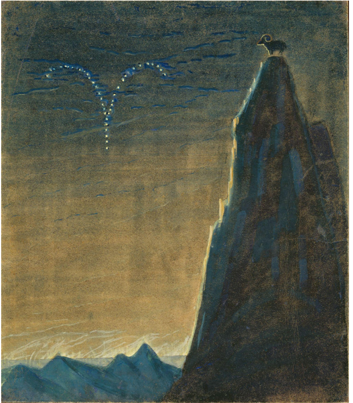
Saulė eina Avino ženklą. III paveikslas iš ciklo „Zodiakas”