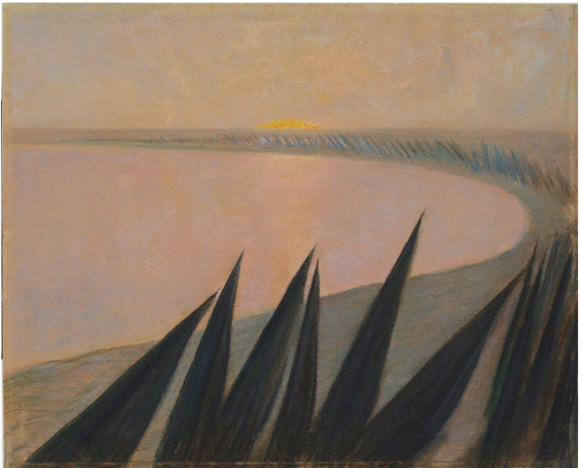
Paveikslas „Liūdesys I” iš ciklo „Liūdesys”

Mano rankose keturių kitų M. K. Čiurlionio paveikslų nuotraukos. Jūsų komandinė užduotis - naudojantis šiomis nuotraukomis ir pasitelkiant gamtines medžiagas (lapus, šakeles, akmenis ir t.t.) pabandyti kuo tiksliau atkurti šiuos paveikslus. Susirinkite reikiamas medžiagas ir savo paveikslą dėliokite ant žemės. Iš šakelių ar kitų gamtinių medžiagų padarykite paveikslo rėmus. Užbaigę paveikslą įsivaizduokite, jog turite galimybę sukurti bet kokią muzikinį kūrinį šiam paveiksliui iliustruoti. Kokie instrumentai jį atliktų? Koks būtų muzikos tempas ir nuotaika? Pristatykite savo atkurtą M. K. Čiurlionio paveikslą klasės draugams ir papasakokite jiems koks muzikos kūrinys galėtų iliustruoti šį dailės kūrinį. Paveikslai: