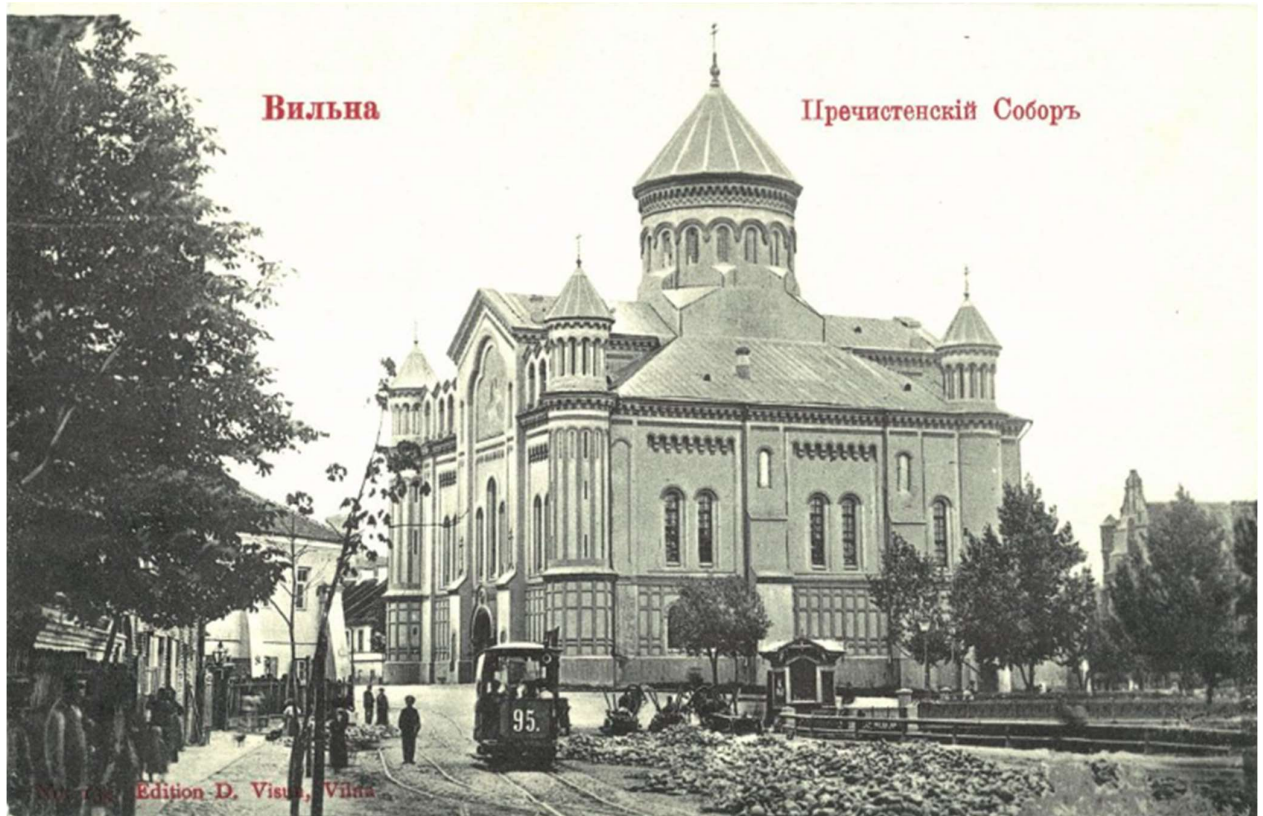
Vilniaus Šviesiausios Dievo motinos cerkvė - stačiatikių katedra, esanti Vilniaus senamiestyje, XX a. pr.