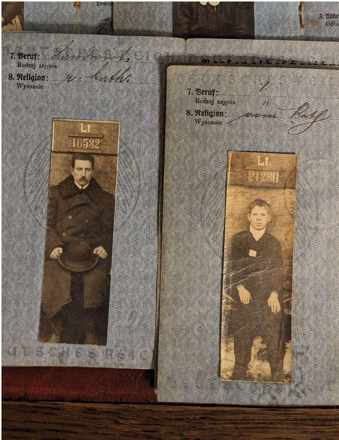
Pasai, kurie buvo išduodami Vokietijos okupuotose Lietuvos teritorijose Pirmojo pasaulinio karo metu