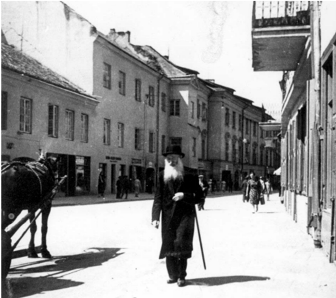
Vilniaus gatvė tarpukariu.