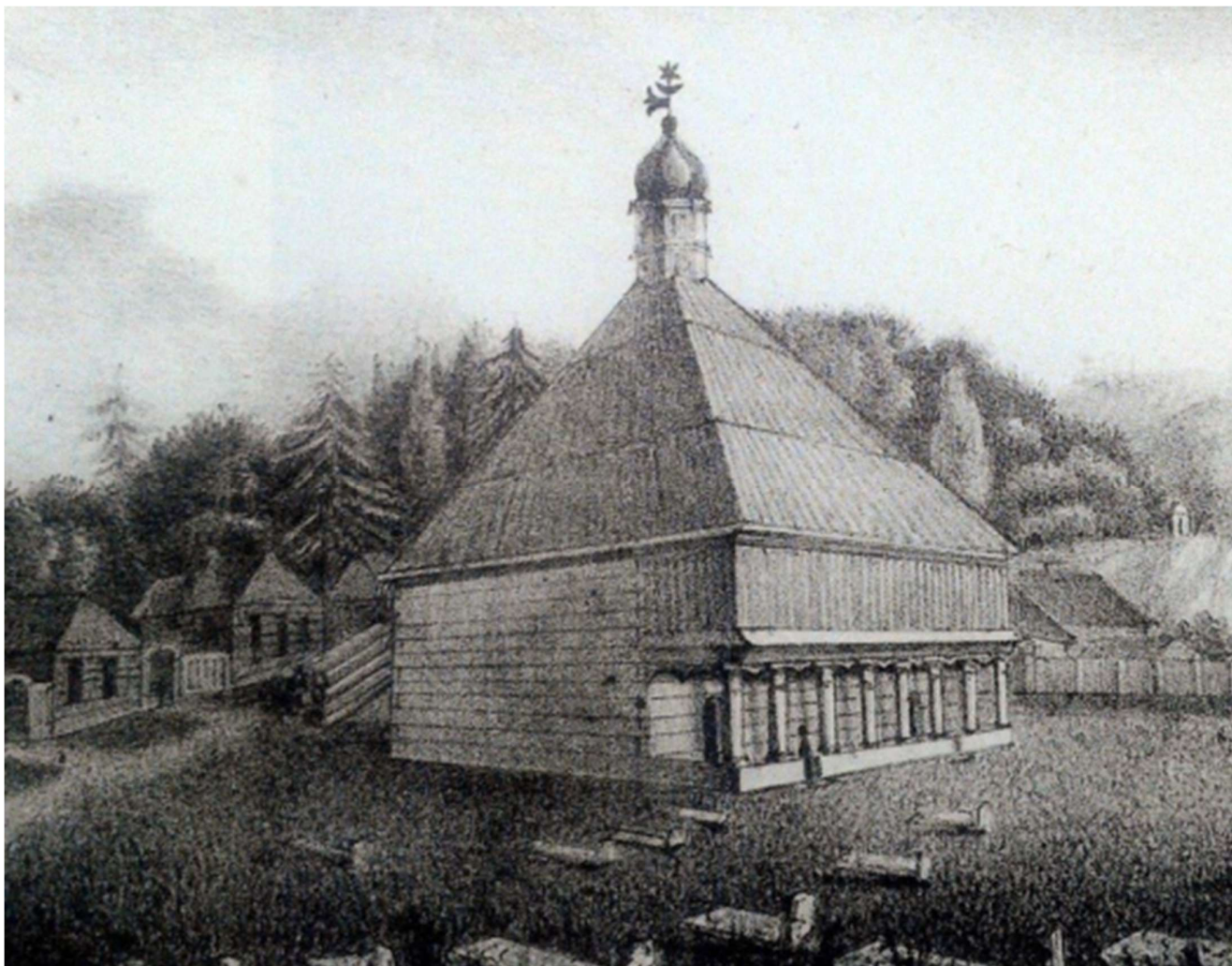
Vilniaus totorių mečetė, 1830 metai, litografija.